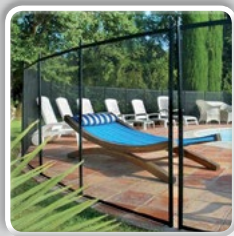
FILET DE CLÔTURE DÉMONTABLE PISCINE