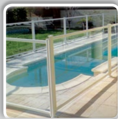
BARRIÈRES PISCINE PANNEAU TRANSPARENT