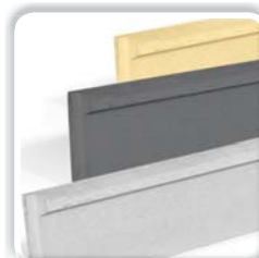
DALLE DE SOUBASSEMENT BÉTON