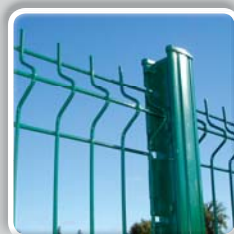
PANNEAU RIGIDE MÉDIUM (fil Ø 4 / 5 mm)