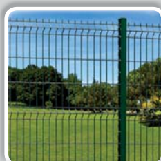
PANNEAU RIGIDE À PLIS (fil Ø 5 mm)