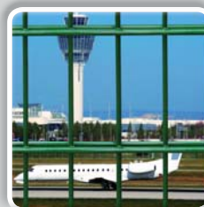
PANNEAU DOUBLE FIL (fil Ø 6/5/6 mm)