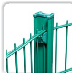
POTEAU À CLIPS