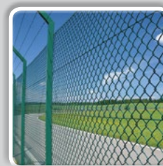
GRILLAGE SIMPLE TORSION