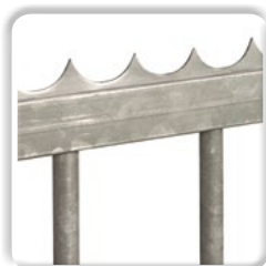
LISSE DÉFENSIVE à souder ou à visser