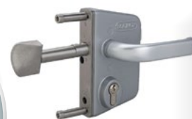
Serrure Locinox avec coffre en aluminium thermolaqué et mécanisme en acier inoxydable