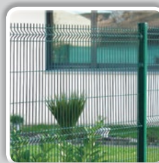
PANNEAU RIGIDE HERCULES®